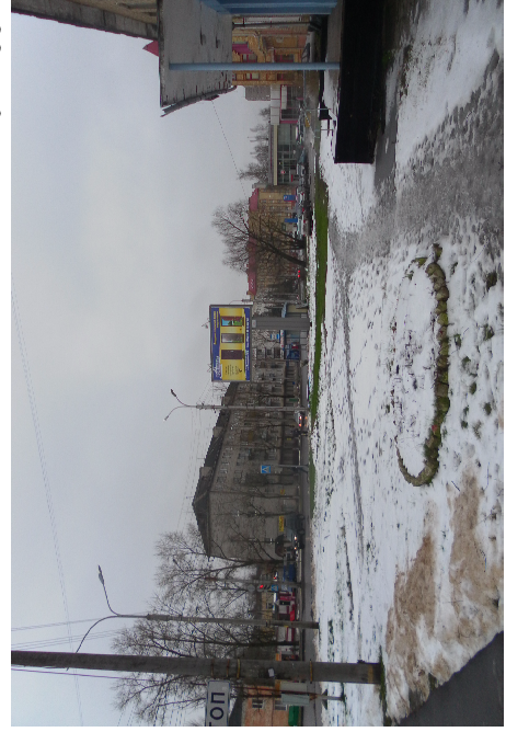
id 1255 А